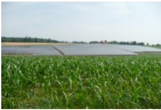
Abb. : Solarpark in Rotthalmünster (DE) , 2,2 MW Leistung