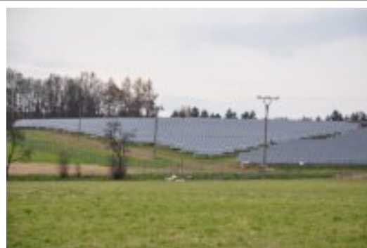
Abb. : Solarpark Komarice ( CZ ) , ca. 847 MW Leistung