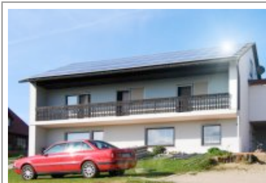
Abb. : Wohnhaus in Regensburg , ca.17 KW Leistung