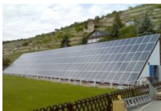
Abb. : Schwimmbad in Freyburg (DE) , ca. 43 KW Leistung