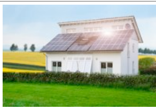
Abb. : Wohnhaus in Willebadessen , ca. 11 KW Leistung