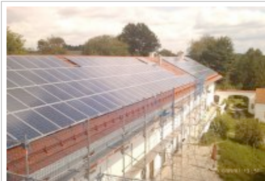
Abb. : Schulgebäude in Lohnkirchen( DE ) , ca. 89 KW Leistung