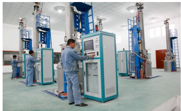
Abb. 1/2/3 : Blick auf die Konzernzentrale und Produktionseinrichtungen. Hier werden unsere Produkte mit modernsten technischen Mitteln hergestellt.