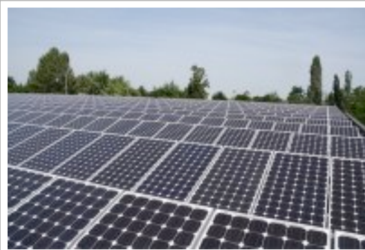
Abb. : Gebäudedach Mannheim DE ) , ca. 210 KW Leistung