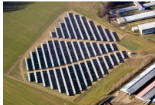
Abb. : Solarpark Tabor ( CZ ) , ca. 1 MW Leistung