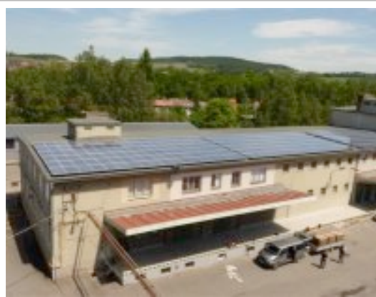
Abb. : Gebäudedach in Pelhrimov (CZ) , ca. 201 KW Leistung