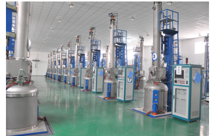
Blick in die Gusstechnikabteilung