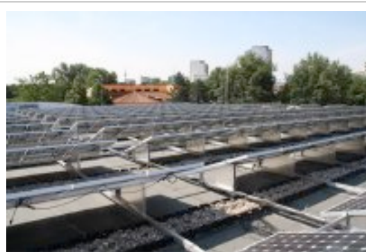
Abb. : Gebäudedach in Esslingen (DE) , ca. 175 KW Leistung