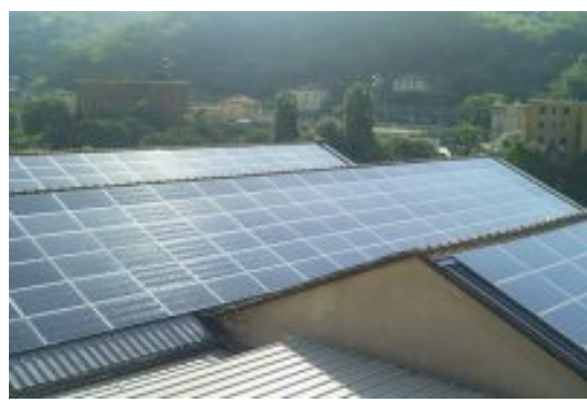
Abb. : Fabrikgebäude in Genua (IT) , ca. 100 KW Leistung