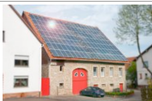
Abb. : Wohnhaus in Warburg ( DE ) , ca. 25 KW Leistung