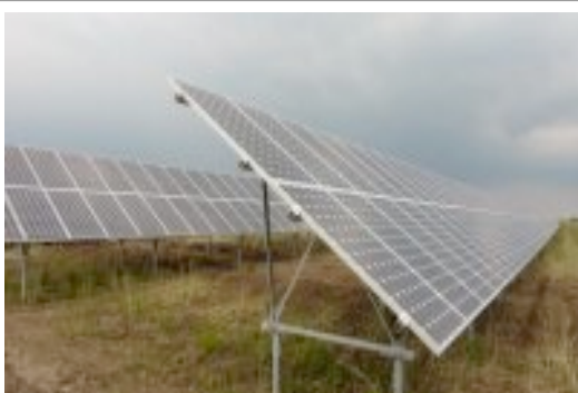
Abb. : Solarpark in Radosovice (CZ), 2,1 MW Leistung